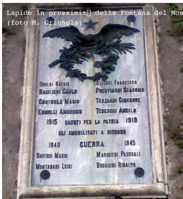
Lapide in prossimità della Fontana del Mosè

Una lapide, collocata nel muraglione alla sinistra della Fontana del Mosè, e 12 targhette, poste alla destra dell'ingresso del Cimitero di Santa Maria del Monte, tramandano la memoria di questi