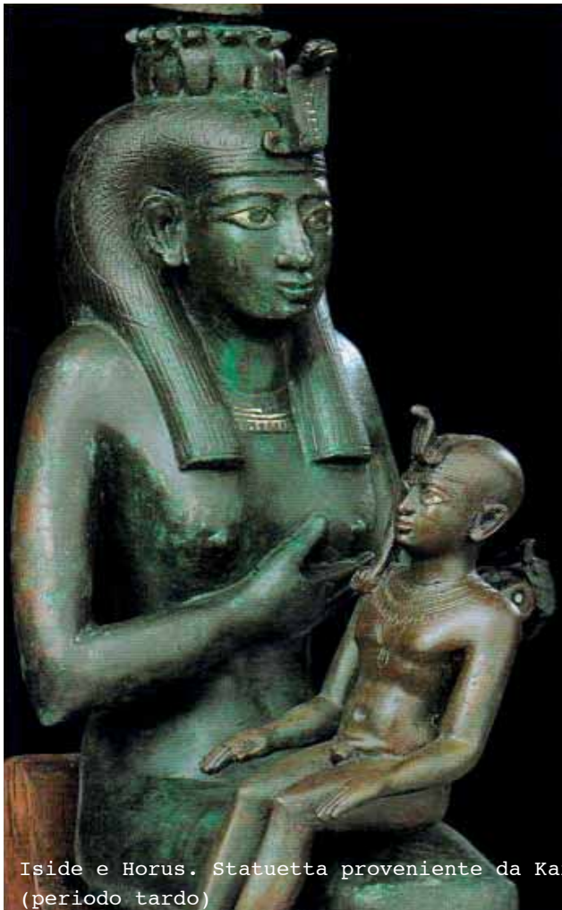
Iside e Horus. Statuetta proveniente da Kar (periodo tardo)

puramente intellettuale con numerose divinità femminili del pantheon sumero-babilonese, greco e romano, da Demetra ad Artemide, e di conseguenza da Cerere a Diana, da Istar a Epona, dalle dee celtiche (si pensi alle cosiddette tre Matres) a quelle orientali. In questi casi noi ci troviamo di fronte ovviamente alla rivisitazione del ben noto "eterno femminino", che negli ultimi decenni ha dato vita ad un dibattito intenso e suggestivo, quanto spesso fumoso e vuoto. Al contrario, durante l'epoca comunemente