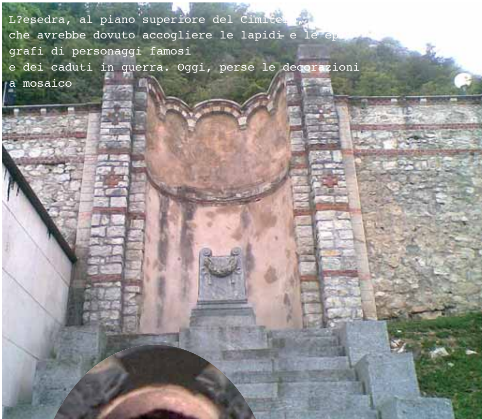
L'edicola, al piano superiore del Cimitero, che avrebbe dovuto accogliere le lapidi e le epigrafi di personaggi famosi e dei caduti in guerra. Oggi, perse le decorazioni a mosaico

Il 4 novembre 1918 fu firmato l'armistizio che