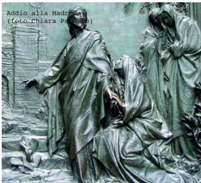
Addio alla Madre

Ciò che colpisce ad un primo sguardo è la diversità dei fogli esposti in mostra, per grandezza,