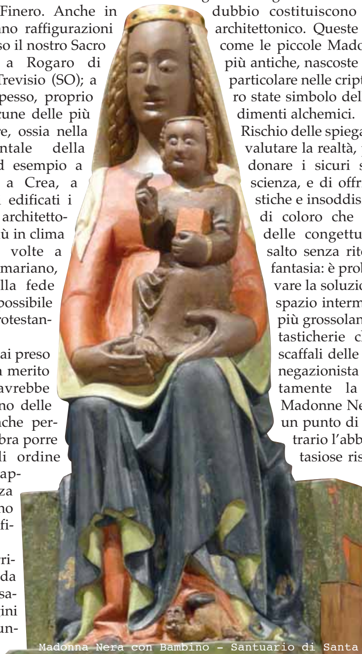
Madonna Nera con Bambino - Santuario di Santa

Una delle spiegazioni più semplici è stata quella per cui le Madonne Nere avessero come prototipi delle sculture lavorate nell'ebano, nel metallo o in pietra scura come il basalto,