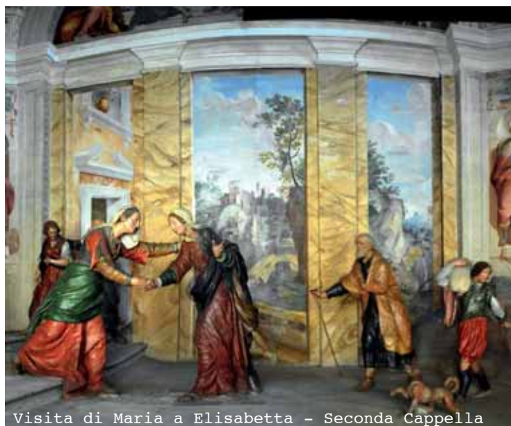
Visita di Maria a Elisabetta - Seconda Cappella

All'inizio di ogni pellegrinaggio, noi pure portiamo nell'animo il peso spesso affannoso del quotidiano. Salendo, rivolgendoci a Maria, cerchiamo di liberarcene. Sacro è il nostro dirigerci al Santuario, ma lo è anche, di riflesso, l'ambiente naturale che scorgiamo dall'alto. Le cappelle