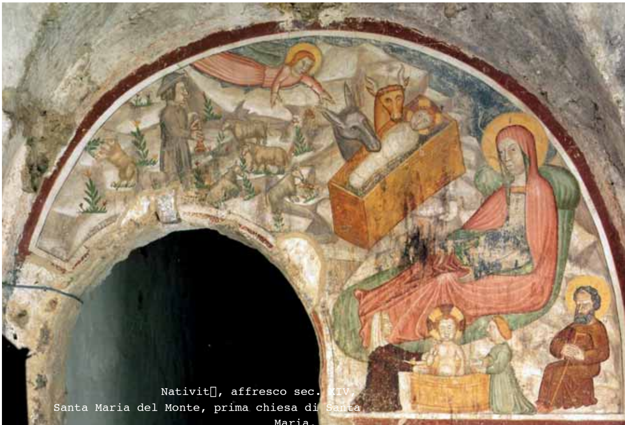
Natività, affresco sec. XIV. Santa Maria del Monte, prima chiesa di Santa Maria,