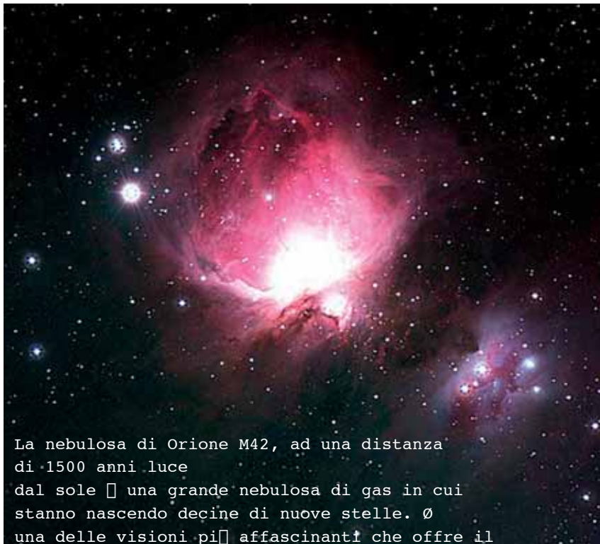
La nebulosa di Orione M42, ad una distanza di 1500 anni luce dal sole è una grande nebulosa di gas in cui stanno nascendo decine di nuove stelle. È una delle visioni più affascinanti che offre il

Man mano che il crepuscolo cederà al buio della sera, la Luna ancora in parte arrossata, uscirà dal cono d'ombra che la terra proietta nello spazio. Entro le 17.30 tornerà a splendere come di consueto.