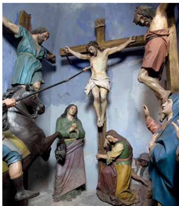
Foto tratte dal volume Il Legno e la Passione. Beniamino Simoni e la Via Crucis di Cerverno , 2009, Collegio Geometri e Geometri Laureati di Brescia in collaborazione con l'Associazione Le