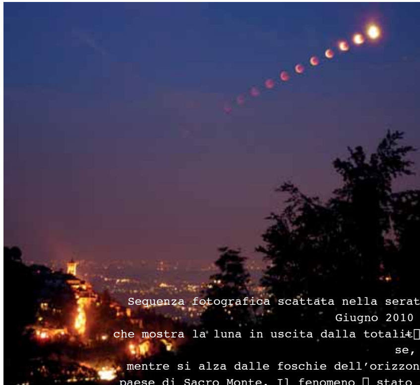
Sequenza fotografica scattata nella serata Giugno 2010 che mostra la luna in uscita dalla totalità se, mentre si alza dalle foschie dell'orizzonte paese di Sacro Monte. Il fenomeno è stato

La luna sarà protagonista di una modesta eclisse nella serata del 10 Dicembre. Il nostro satellite sorgerà alle 16,39 mentre già starà uscendo dalla fase di totalità che si conclude alle 15:57.