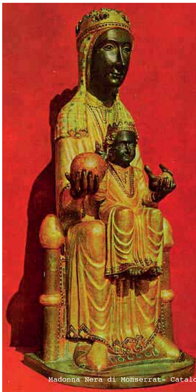
Madonna Nera di Monserrat- Catalogo

immagine di Iside, con la sua pacatezza spirituale, la sua benevola promessa di immortalità, appariva agli occhi di molti come una stella in un cielo tempestoso, suscitando nei loro cuori una devozione estatica non dissimile da quella che, nel Medioevo, fu tributata alla Vergine Maria. ... E non è detto che si tratti di una somiglianza puramente accidentale. L'antico Egitto può aver contribuito al sontuoso simbolismo della Chiesa cattolica, e alle rarefatte astrazioni della sua teologia. Senza dubbio nell'iconografia, l'immagine di Iside che allatta il bimbo Horo è così simile a quella della Madonna con Bambino che, a volte, riceveva l'adorazione di cristiani inconsapevoli.”. Il modello iconografico paradigmatico di Iside e Horus, costoro sì spesso scolpiti in piccole statuette di materiale metallico scuro, non è da sottovalutare, ed è un fatto concreto, a differenza dell'accostamento