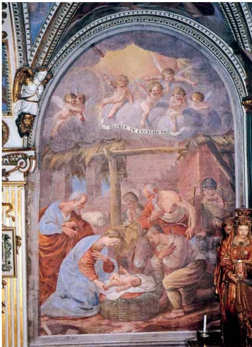
Presepio o Adorazione dei pastori, affresco, 1663, Santa Maria del

Il creato intero davanti a questo avvenimento incredibile, per un momento sta, ammutolito, col