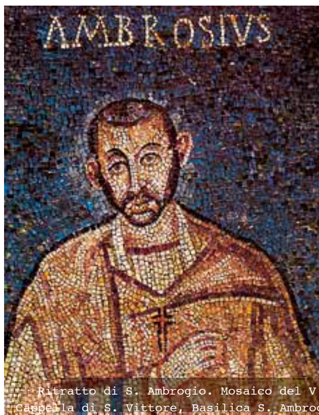
Ritratto di S. Ambrogio. Mosaico del V secolo. Cappella di S. Vittore, Basilica S. Ambrogio

Per tornare a San Luca, valente pittore e quasi contemporaneo di Gesù, sarebbe stata opera sua il primo ritratto della Madonna, cui si sarebbero ispirati gli artisti posteriori: in questo dipinto l'evangelista avrebbe inspiegabilmente rappresentato la Madre di Cristo con la carnagione molto scura. Secondo la leggenda, da lì sarebbe sorto l'uso della raffigurazione delle cosiddette Madonne Nere che, sin dal Medioevo, furono oggetto di venerazione in molte città e santuari europei: è impossibile non tener conto del fatto che alcuni dei luoghi di culto mariani più noti, situati soprattutto in Francia, Italia e Spagna, ma anche in Polonia, Portogallo, Svizzera, Russia, ecc., accolgono dipinti o, più spesso, sculture della Madonna caratterizzati da questa particolarità somatica: rimane misterioso il motivo per cui la Madonna sia stata rappresentata così, dal momento che, oltretutto, i tratti del suo viso sono sempre di tipo caucasico anche quando la pelle appare particolarmente scura.