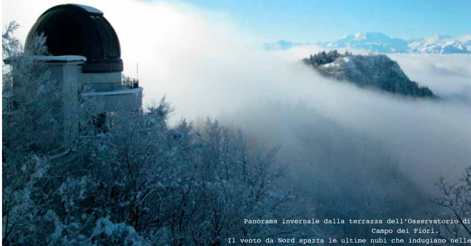
Panorama invernale dalla terrazza dell'Osservatorio di Campo dei Fiori.

Il vento da Nord spazza le ultime nubi che indugiano nelle