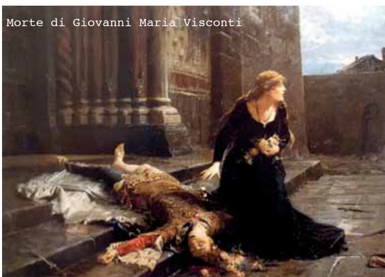
Morte di Giovanni Maria Visconti

L'espressione "per Milano" è quindi dovuta, soprattutto se si scorre il corposo elenco di opere che l'artista realizzò in seguito a committenze