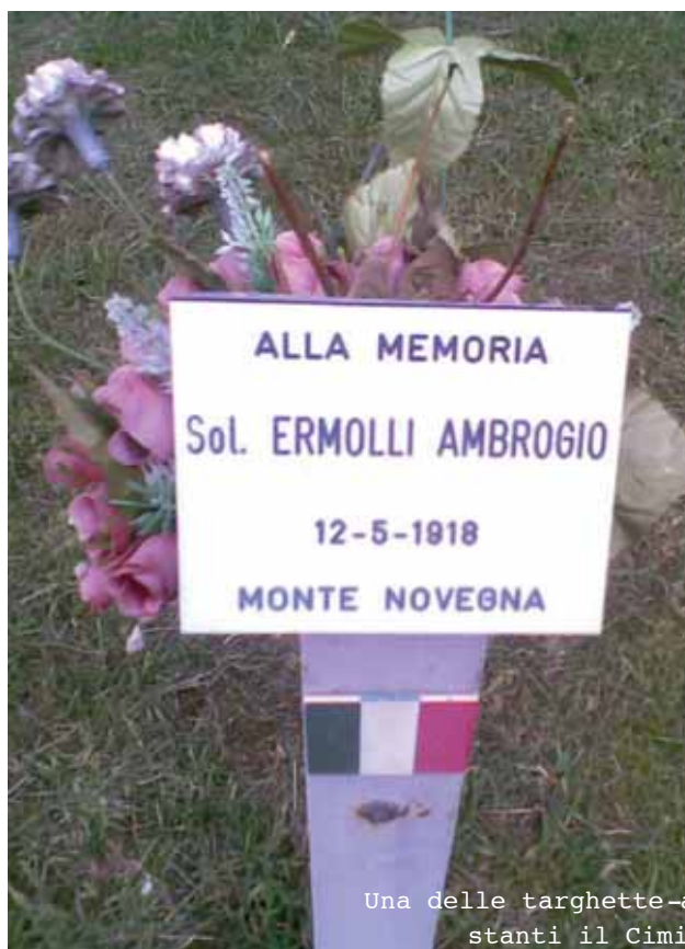
Una delle targhette-a stanti il Cimit

caduti, fino a qualche decennio or sono rievocata il 4 novembre di ogni anno con una breve cerimonia commemorativa.