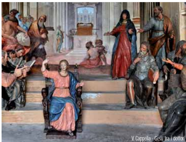
V Cappella - Gesù tra i dottori