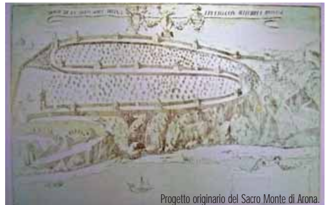
Progetto originario del Sacro Monte di Arona.