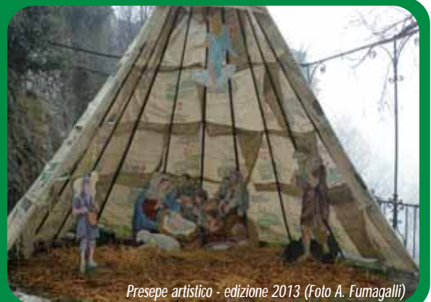
Presepe artistico - edizione 2013

Nel periodo natalizio, potrete ammirare il nostro presepe artistico con le figure del pittore Mario Alioli nei giardinetti sopra il Mosè al Sacro Monte. Un particolare ringraziamento va al Gruppo Senior del CAI che anche quest'anno ne ha curato la realizzazione.