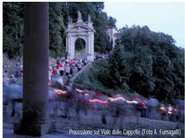
Processione sul Viale delle Cappelle

Questo è il luogo della manifestazione di Dio, del suo apparire entro la storia e le vicende umane. Qui da più di un millennio risuonano le parole degli angeli: "Oggi è nato per voi un Salvatore". Parole che penetrano nel cuore e trasformano i luoghi. L'incarnazione di Dio è fatto quanto mai fisico, tangibile, avvenuto in un tempo e in un luogo precisi che, lontani, hanno bisogno della concretezza di un luogo e di un oggi perché sia annunciata. Un luogo ed un oggi non vuoti ma abitati da una comunità che ascolta e racconta nel proprio oggi la presenza di Dio. E come è consolante sapere che questa comunità, in una sequen-