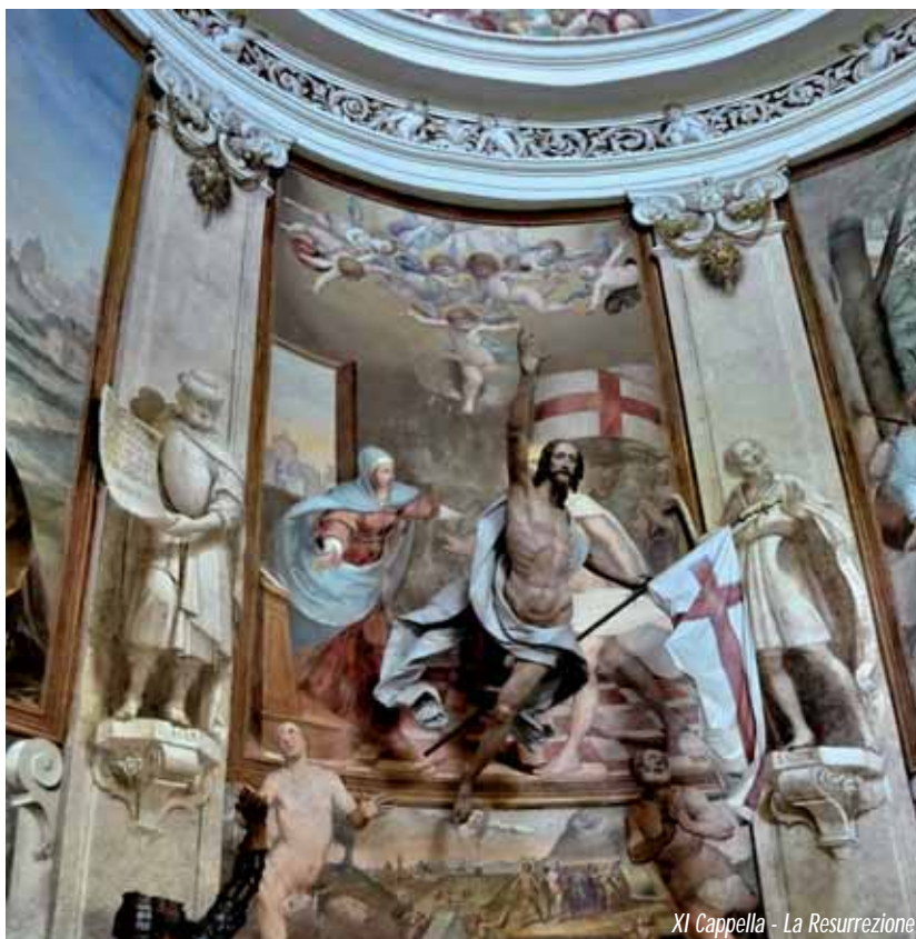
XI Cappella - La Resurrezione

Faccio un altro esempio: Gesù che incontra Lazzaro (Giov. 11). Vedono tutti che Gesù fa ritornare Lazzaro in vita e il Vangelo dice: "Molti credettero in lui e altri, i capi dei giudei, decisero di ucciderlo". Hanno visto la stessa scena di un uomo che salva un altro dalla morte e lo