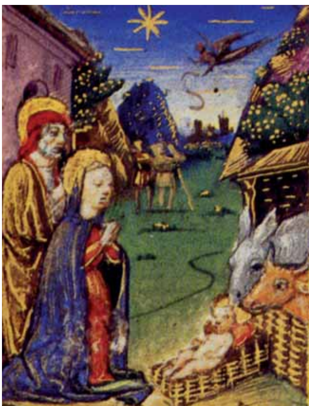
Cristoforo de' Predis, Natività (part.), Libro d'Ore Borromeo Milano, Biblioteca Ambrosiana

Anche la minuscola Natività del Libro d'Ore Borromeo, firmato da Cristoforo ma non datato, miniato per una sposa Borromeo e oggi custodito nella Biblioteca Ambrosiana, ospita l'annuncio ai pastori. È tracciato in modo sintetico con un virtuosismo non da poco, se si calcola che è su una pagina di 10 centimetri di altezza e di 7,5 di larghezza il cui bordo decorativo consistente inquadra ben quattro scene (oltre alla Natività trovano posto la Presentazione al tempio , L'Adorazione dei Magi e La fuga in Egitto ). Era un testo tascabile, utilizzato per la preghiera personale, e perciò di