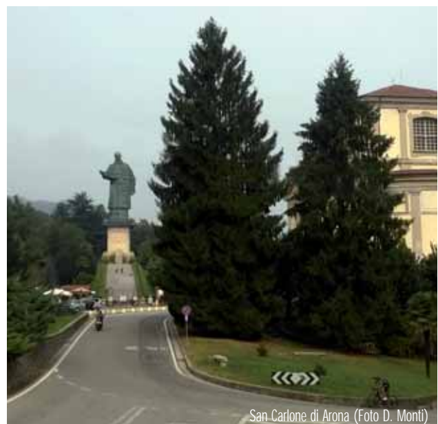
San Carlone di Arona