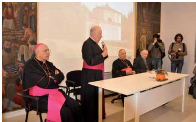
20 settembre 2014 - Inaugurazione del Centro Espositivo

Accanto alla "Casa-Museo", il "Museo Baroffio e del Santuario", riaperto dall'anno 2001 sulla piazzetta del monastero e diretto dalla sempre disponibile e pragmatica Laura Marazzi . Qui proseguono con successo le iniziative rivolte ai giovani e le visite guidate a tema per gli adulti; ... e poi il Centro