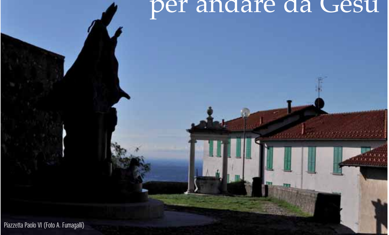
Piazzetta Paolo VI

Estratti dall'omelia di Paolo VI in occasione della sua visita pastorale a S.Maria del Monte.