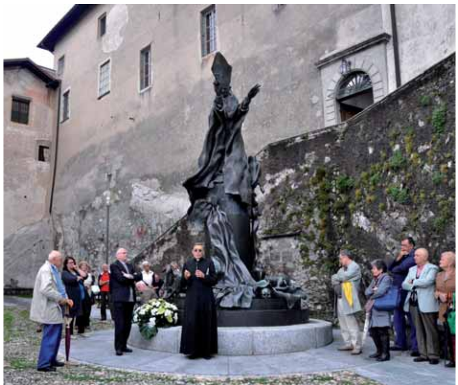
2 agosto 2014 - Mons. Ettore Malnati commemora il 36° anniversario della morte di Paolo VI

Il vincolo che lega Maria e l'Europa si nota anche nella bandiera europea. Il vessillo con le dodici stelle d'oro su campo blu che si muove al vento sugli edifici pubblici ed in occasione di