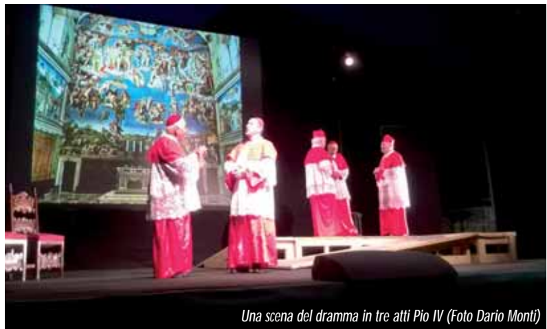
Una scena del dramma in tre atti Pio IV