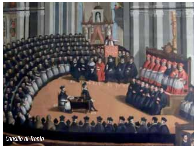
Concilio di Trento