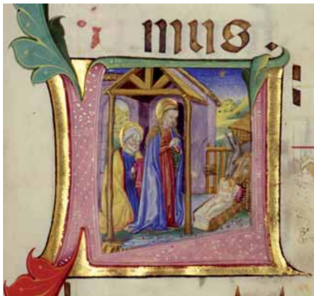
Cristoforo de' Predis, Natività , Miniatura Museo Baroffio e del Santuario.