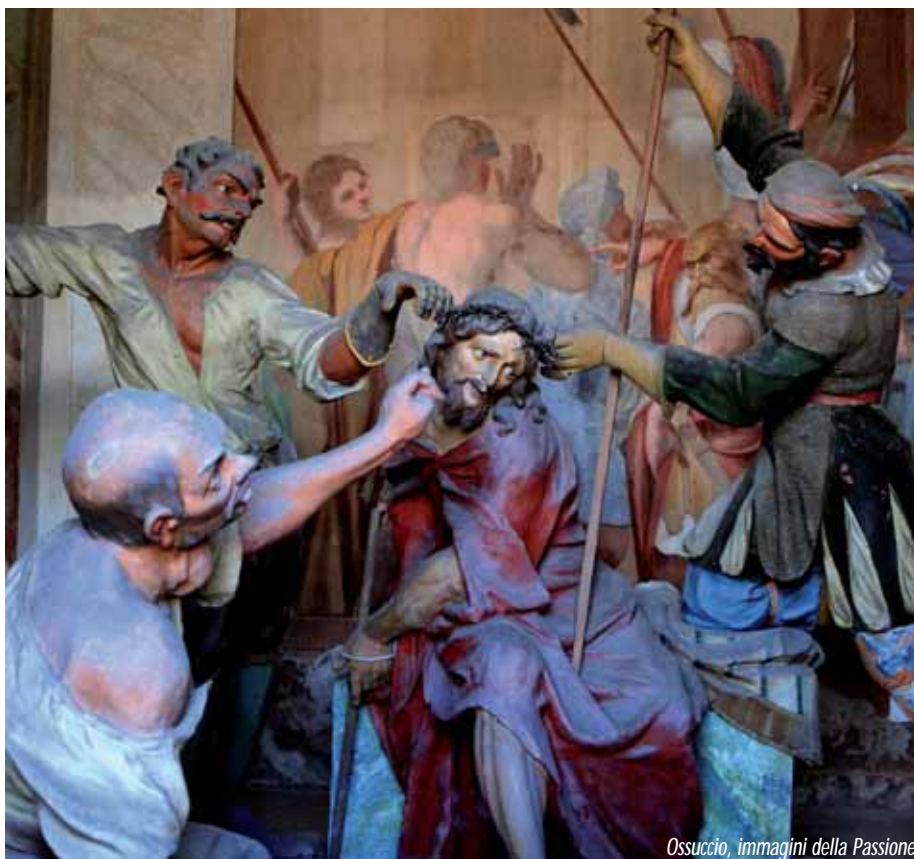
Ossuccio, immagini della Passione