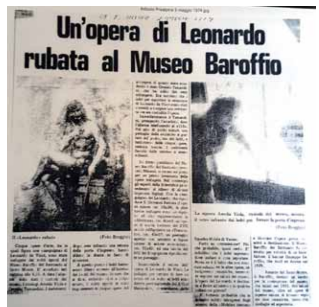
Articolo della Prealpina del 3 maggio 1974