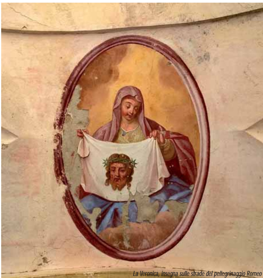
La Veronica, insegna sulle strade del pellegrinaggio Romeo