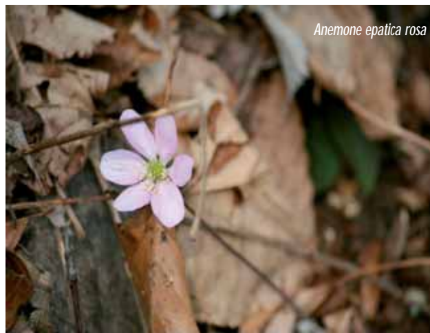
Anemone epatica rosa

All'interno del bosco più rado si estende un prato di pervinca minore, Vinca minor L.. Questa