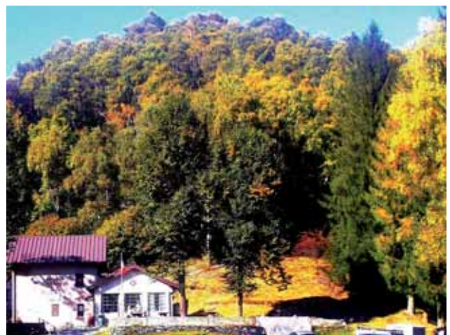
Rifugio De Grandi Adamoli al Cuvignone