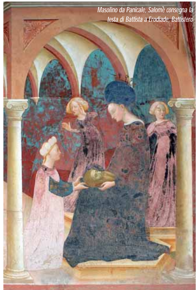
Masolino da Panicale, Salomè consegna la testa di Battista a Erodiade, Battistero