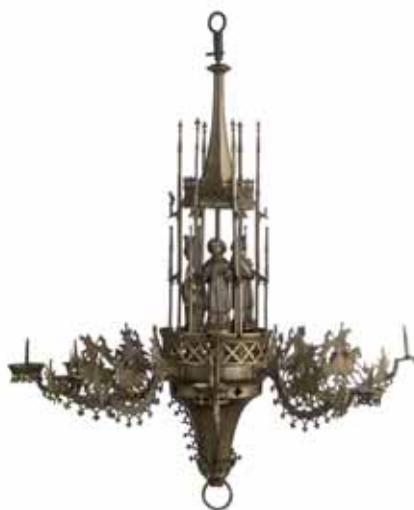
Chandelier fiammingo XV secolo

E quando al primo esame di storia dell'arte le fu chiesto di portare una ricerca su una tomba eminente della sua zona, scelse quella del cardinale alla Colle-