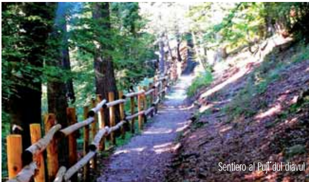
Sentiero al Pujò dul diavul