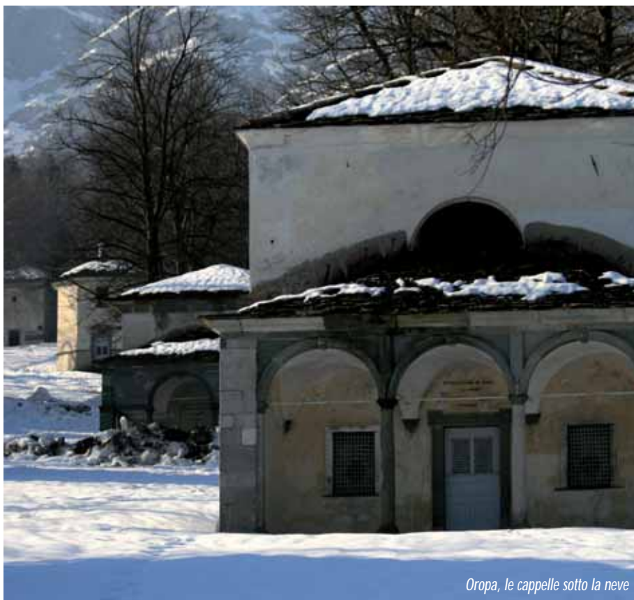
Oropa, le cappelle sotto la neve

Il web si è rivelato uno spazio unico e prezioso perché, a differenza del giornale e della rivista, permette di conservare nel tempo la visibilità di articoli che, altrimenti, risulterebbero difficilmente dispo-