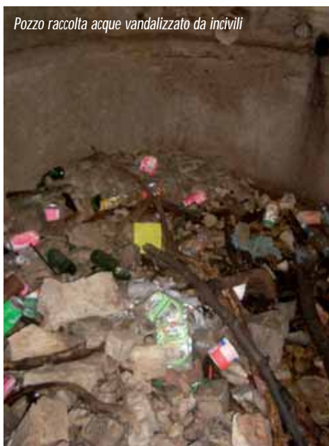
Pozzo raccolta acque vandalizzato da incivili