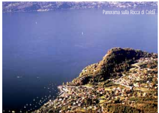
Panorama sulla Rocca di Caldà