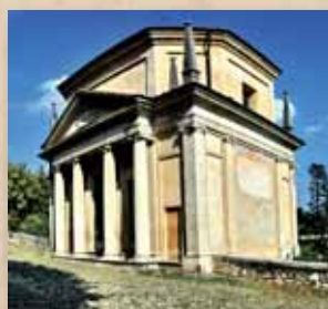
Seconda Cappella - La Visitazione di Maria alla cugina Elisabetta 2015