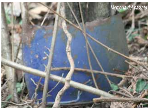
Memoria del passato