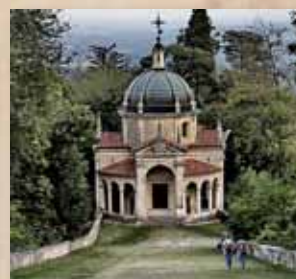
Quarta Cappella: la presentazione al Tempio 2017