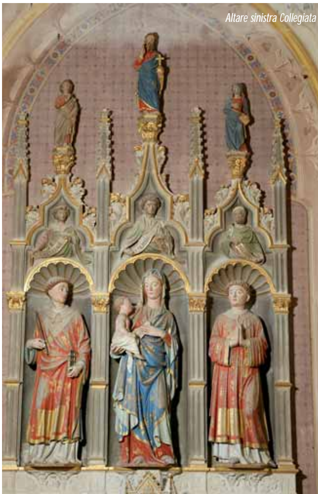
Altare sinistra Collegiata

giata. Due chiari segni del destino. Dal 2000 presta la sua opera due volte la settimana alla Pinacoteca di Brera a Milano dove organizza attività per bambini, itinerari tematici per adulti e progetti didattici specifici. Dal 2002 al 2017 è stata conservatore e responsabile dei servizi educativi del museo Baroffio per conto della Fondazione Paolo VI per il Sacro Monte di Varese.