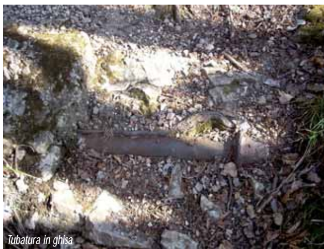
Tubatura in ghisa