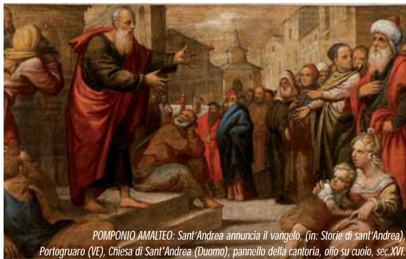
POMPONIO AMALTEO: Sant'Andrea annuncia il vangelo, (in: Storie di sant'Andrea ), Portogruaro (VE), Chiesa di Sant'Andrea (Duomo), pannello della cantoria, olio su cuoio, sec. XVI.

“Il Signore è risorto!”, cioè ha vinto la morte e, con essa, ha debellato la forza di ogni male e del nostro stesso peccato. Questo vale non solo per i primi che l'hanno visto, ma per ogni uomo; anche per noi, che