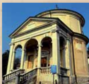
Chiesa dell'Immacolata 2016