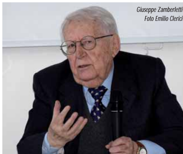
Giuseppe Zamberletti

lati da Milano, che guardavano i bombardamenti alleati sulla città chiedendosi se la propria casa fosse stata colpita, oppure dalle Pizzelle quando gli aerei tedeschi attaccarono i partigiani asserragliati sul San Martino in Valcuvia, iniziarono a cancellare: la comunità. Che dopo la guerra non fu più la stessa e che subì il colpo decisivo con la sciagurata decisione di togliere i binari del tram e delle due funicolari. Le migliorate condizioni economiche fecero il resto, allargando i confini verso i quali andare a trascorrere le vacanze estive. Dagli anni Cinquanta, villeggiare al Sacro Monte passò di moda, chiusero i negozi, gli alberghi si trasformarono in ristoranti o chiusero del tutto. Come restare quassù, praticamente senza servizi? Resistetti fin dopo i trent'anni, poi il lavoro e la politica mi indussero a scendere a valle