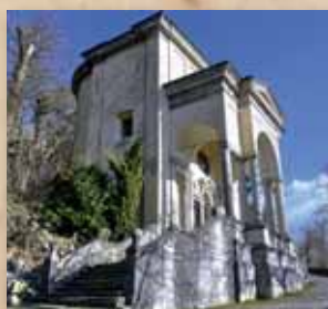
Undicesima Cappella La Resurrezione 2014