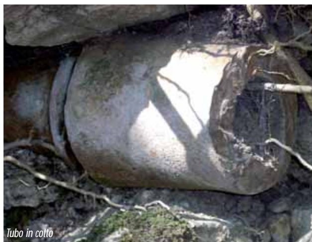
Tubo in cotto