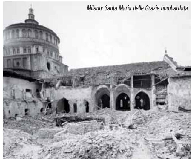
Milano: Santa Maria delle Grazie bombardata