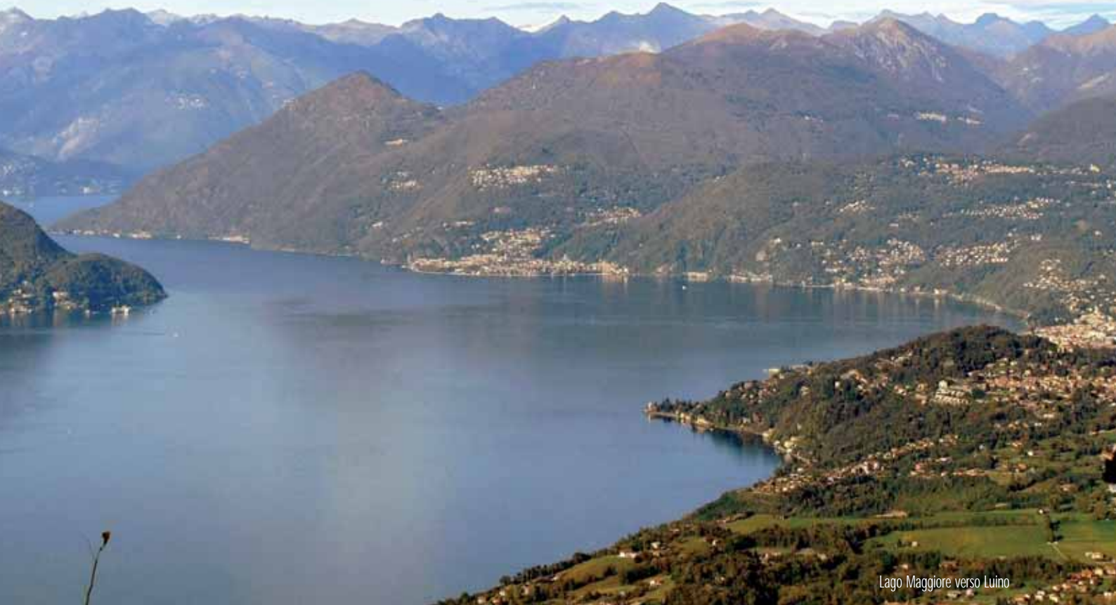
Lago Maggiore verso Luino

Sentiero prealpino: Fontana dei Pianeggi di Castelveccana - Cappella del Pianchè - Spurtasc - Acquetta - Pianizze - Rifugio CAI Besozzo De Grandi Adamoli - Pujò dul diavul - Valle Spiancarina e dei Sassi - Pianeggi.