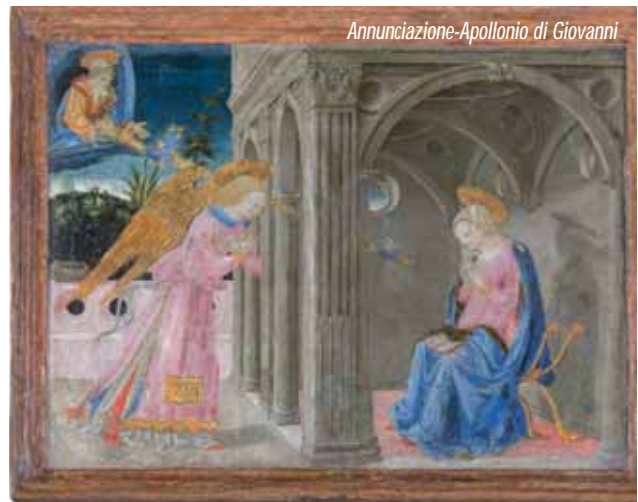
Annunciazione-Apollonio di Giovanni