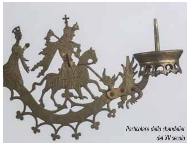
Particolare dello chandelier del XV secolo

Il complesso artistico e religioso di Castiglione Olona comprende il campanile, il battistero affrescato da Masolino da Panicale con le Storie di San Giovanni Battista, il museo e la chiesa della Beata Vergine e dei santi Stefano e Lorenzo, detta Collegiata per la presen-