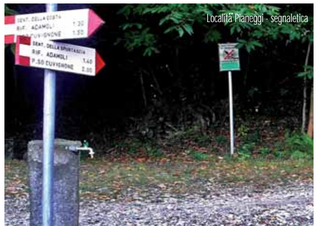
Località Pianeggi - segnaletica