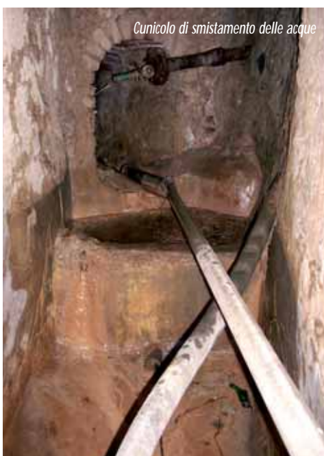
Cunicolo di smistamento delle acque