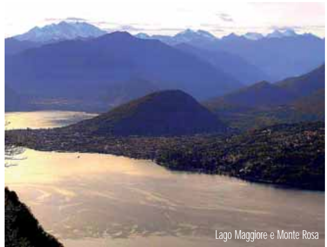
Lago Maggiore e Monte Rosa