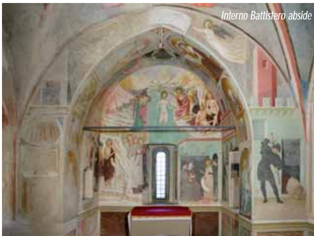
Interno Battistero abside