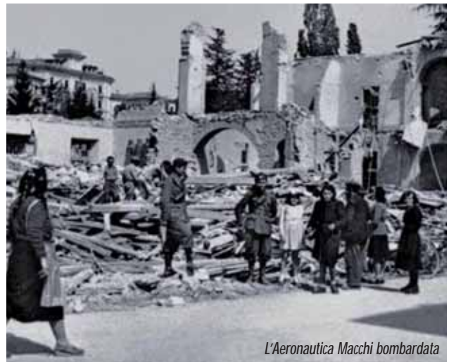
L'Aeronautica Macchi bombardata

anch'io". La domanda, questo punto, è d'obbligo. Santa Maria del Monte ha iniziato un cammino di rinascita dopo gli anni bui della seconda metà del Novecento, ma potrà tornare ad essere una vera e propria comunità? "A condizione che si metta mano al risanamento edilizio, si creino i parcheggi a valle e, soprattutto, vengano ripristinate entrambe le funicolari e il tram da Varese, perchè le cosiddette rotture di carico tra un mezzo di trasporto e l'altro scoraggiano i visitatori. Utopie? In altri luoghi, per esempio a Roma, si sono accorti che aver tolto il tram è stato un errore e lo stanno rimettendo. Si può fare anche a Varese. Per il resto, la palla non può che passare nelle mani dei parlamentari locali. Da loro deve partire il segnale di rilancio definitivo del Sacro Monte".