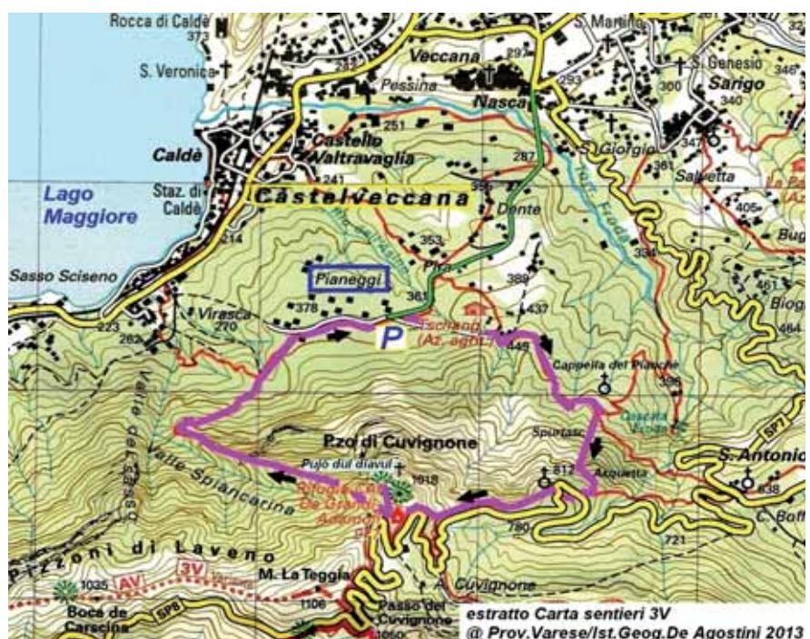
estratto Carta sentieri 3V @ Prov.Varese/ist.Geog.De Agostini 2013

L'itinerario quasi a picco sul Lago Maggiore si atesta sulle pendici nord del Pizzo di Cuvignone e del Monte La Tegia e Pizzoni di Laveno, tutte montagne poco superiori ai mille metri. Grandioso panorama per buona parte del percorso e in special modo nella tratta che scende a Pianeggi dal Rifugio De Grandi Adamoli attraverso la caratteristica Valle Spiancarina e Valle dei Sassi. Si percorre per la maggior parte dell'anno, neve permettendo. Immerso in boschi cedui e spazi naturali che permettono la visione sul Lago Maggiore e le Alpi con ampia panora-