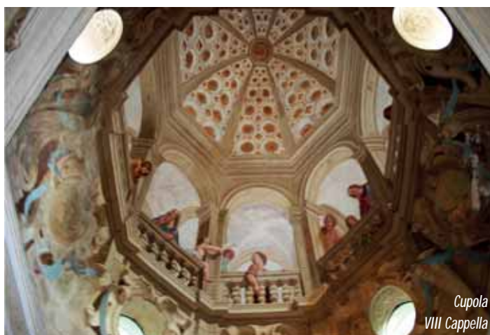
Cupola VIII Cappella

In tanti anni di dedizione al Sacro Monte ho conti-