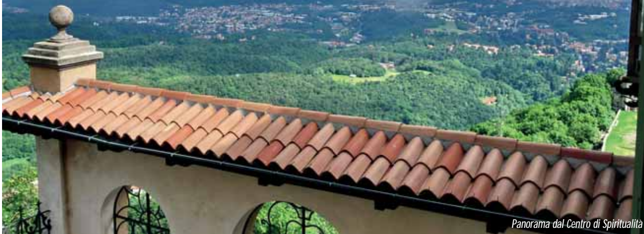
Panorama dal Centro di Spiritualità

Il 16 maggio scorso, nonostante un tempo che definire inclemente è un eufemismo, ci siamo ritrovati in una ventina di persone, tra soci e simpatizzanti, al Centro di Spiritualità e Accoglienza delle Romite Ambrosiane per un incontro particolare.