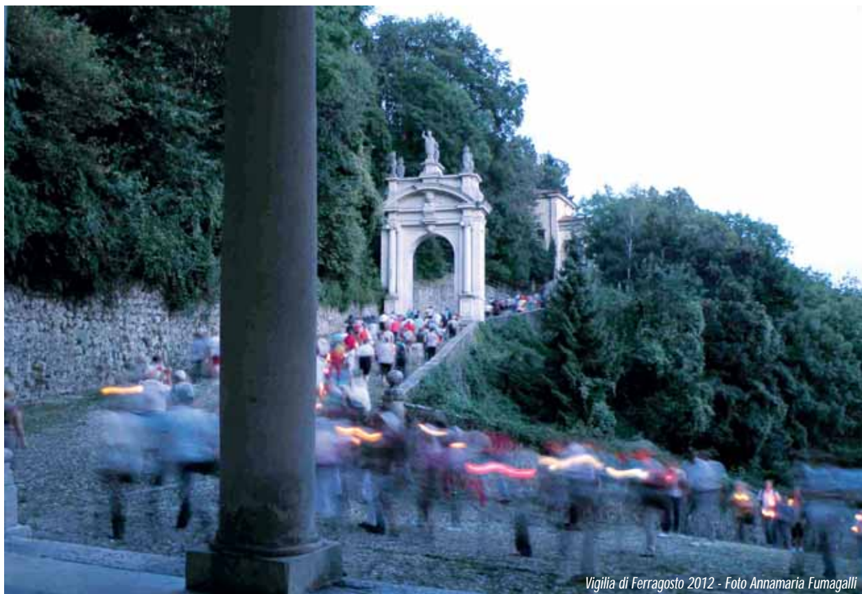
Vigilia di Ferragosto 2012