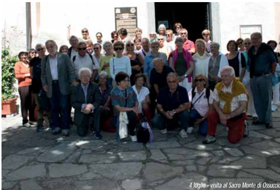
4 luglio - visita al Sacro Monte di Ossuccio

Il luogo che l'UNESCO ha riconosciuto patrimonio dell'umanità è il contesto della via Sacra, costituito da cappelle monumentali, ben conservate con la rappresentazione delle scene del SS. Rosario. Una specificità che, unita alla presenza del Borgo ancora abitato e ben conservato, nato intorno all'antico convento delle suore romite e al fatto che l'intero bene sia inserito nel contesto del Parco Naturale del Campo dei Fiori, distingue la preziosità varesina. Il Sacro Monte di Varese è un esempio unico di una espressione di fede che ha disegnato, in periodo di Controriforma, l'arco Prealpino, trasformandolo in un baluardo al protestantesimo. Questa unicità, ma non solo, ha ispirato il Comune di Varese a farsi promotore presso il