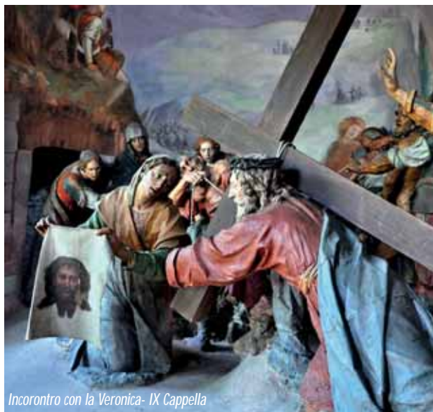
Incontro con la Veronica - IX Cappella