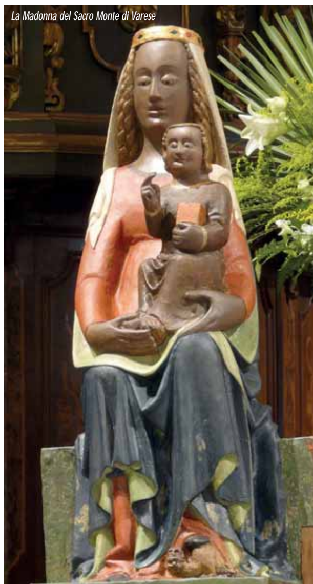
La Madonna del Sacro Monte di Varese

Queste ultime seguono tre filoni principali: quello razionalista, quello esoterico e quello antropologico: gli esponenti del primo banalizzano la questione, ritenendo che le prime Madonne Nere fossero tali quasi inconsapevolmente per la qualità del legno scelto dallo scultore, piuttosto che per l'annerimento dovuto al fumo delle candele nelle buie cripte