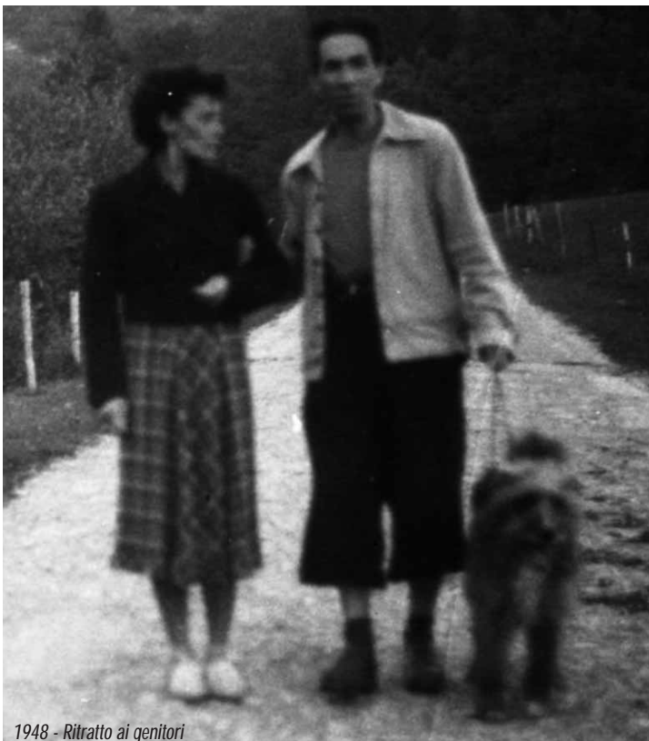
1948 - Ritratto ai genitori