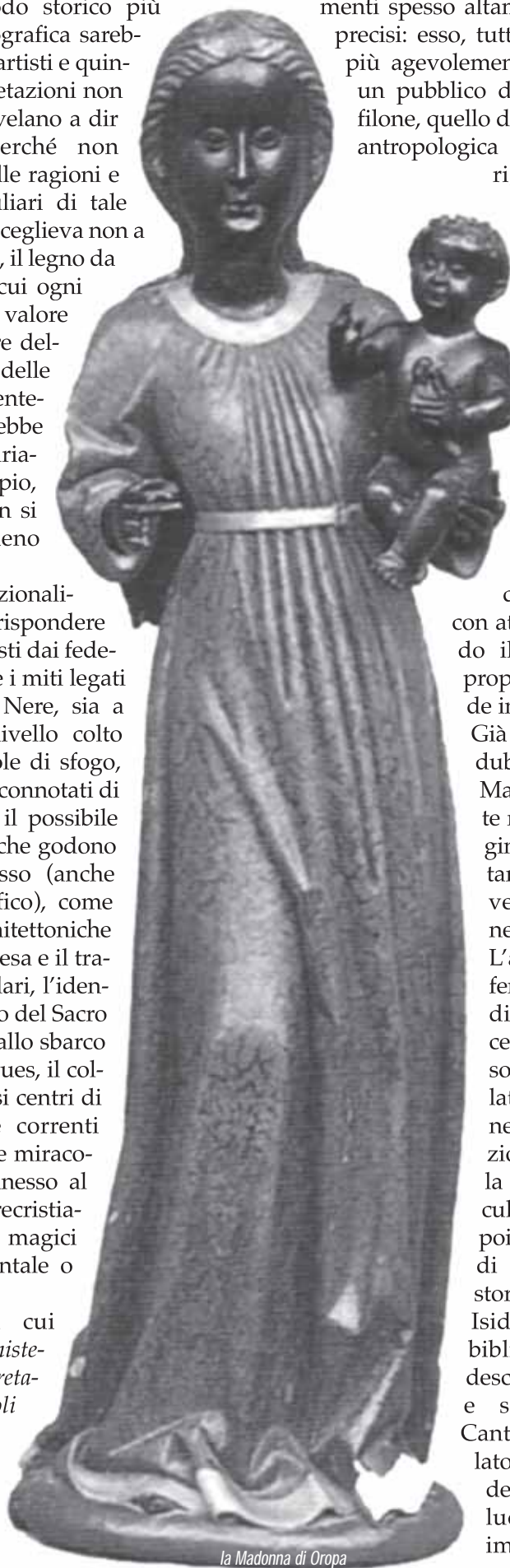
la Madonna di Oropa

L'antropologia studia così il fenomeno sia in prospettiva diacronica, sia diatopica, cercando fili comuni e un sostrato significativo: da un lato reperisce la connotazione iconografica in una tradizione ancestrale, che vede la sua genesi addirittura nel culto delle Magnae Matres, e poi scorre attraverso le grandi divinità femminili della storia da Diana/Artemide a Iside, con giustificazioni bibliche ad esempio nella descrizione femminile poetica e simbolica presente nel Cantico dei Cantici. D'altro lato vengono poste in evidenza le caratteristiche dei luoghi ove si trovano le immagini in oggetto, che