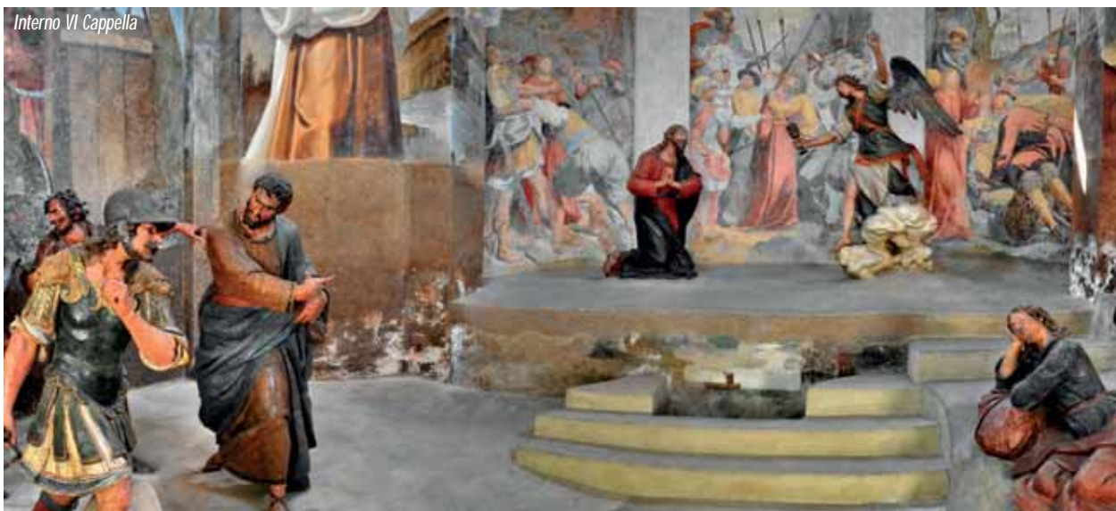
Interno VI Cappella

Donna de Paradiso ha la struttura di una sacra rappresentazione e alcuni personaggi. Ecco il Nunzio, voce guida che presenta a Maria i successivi momenti della Passione; ecco il Popolo: pronuncia battute di feroce condanna. Alla Maddalena, terzo silenzioso personaggio, Maria chiede soccorso all'improvviso, primo annuncio del dramma.