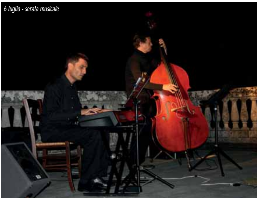
6 luglio - serata musicale

E' un sito in cui l'arte si fonde con una fede profonda, radicata in secoli di storia, si incontra con le tradizioni e la voglia di passeggiate, si perde nella contemplazione di panorami e nel misticismo della meditazione dei Misteri. La via Sacra racconta a chi ha voglia di osservare e affascina