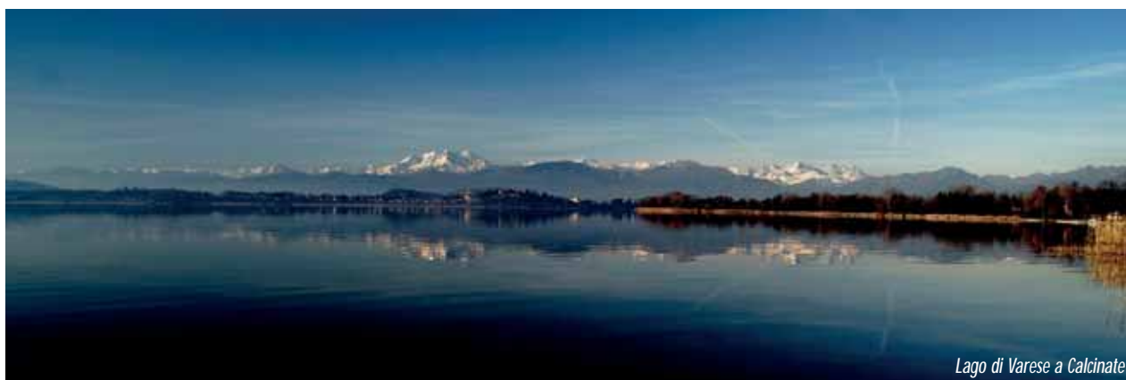
Lago di Varese a Calcinate