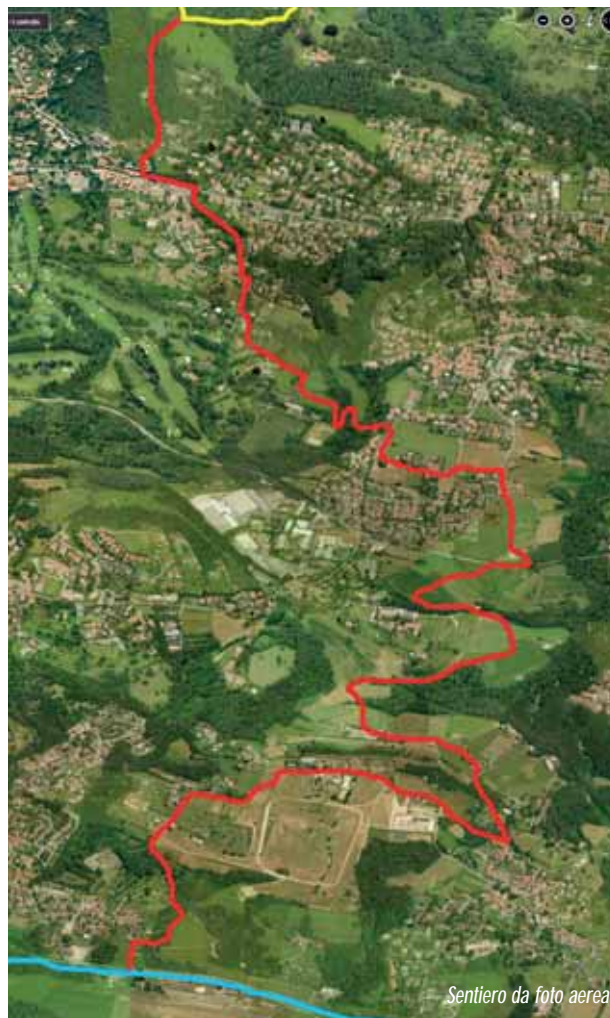
Sentiero da foto aerea

Tutta la fascia a sud del massiccio del Campo dei Fiori è caratterizzata da un'urbanizzazione lineare da Varese a Gavirate molto diffusa ma con una bassa densità edilizia media, che lascia quindi ampi spazi ancora liberi, di grande valore ambientale e paesistico. Questi spazi, suddivisi purtroppo su vari Comuni, non sono stati minimamente pianificati né sufficientemente cono-