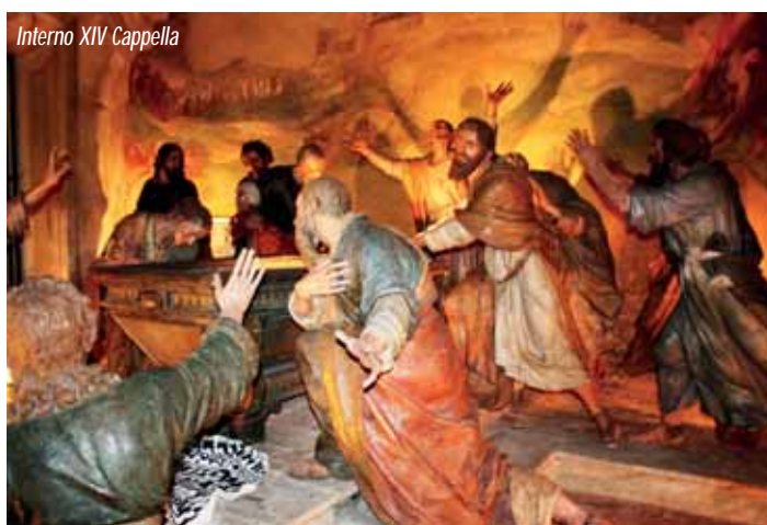
Interno XIV Cappella