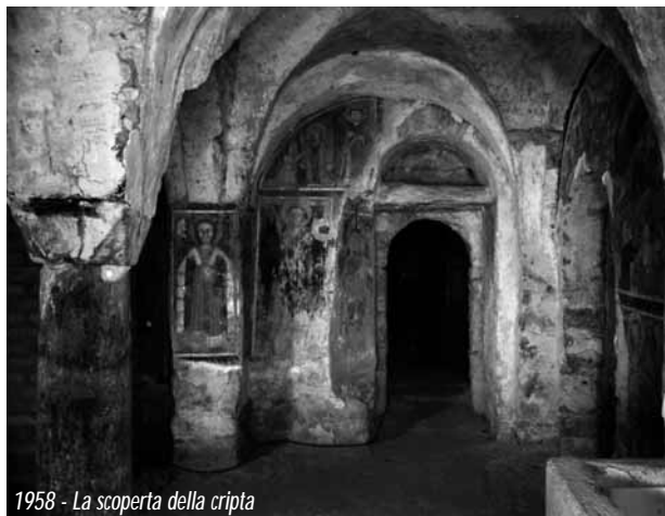
1958 - La scoperta della cripta

Il valore della produzione fotografica di Vivi Papi è noto, e l'archivio è già stato consultato e utilizzato per il corredo iconografico di pubblicazioni a stampa e conferenze e non solo: anche per siti internet (si veda ad esempio quello del pittore Giuseppe Montanari), per studi finalizzati all'identificazione di affreschi o a lavori di ripristino urbanistico, per immagini devozionali e, perfino, per la decorazione di un bus navetta.