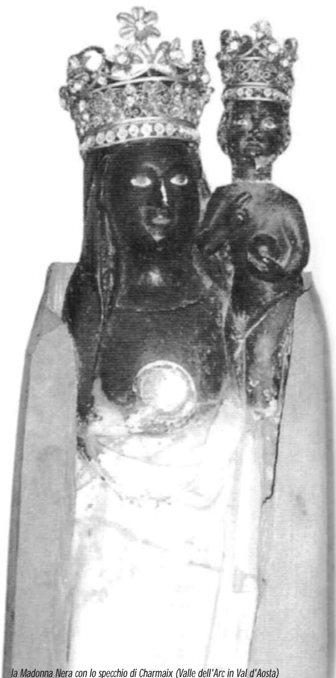
la Madonna Nera con lo specchio di Charmaix (Valle dell'Arc in Val d'Aosta)