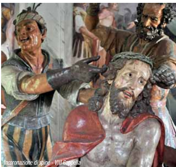
Incoronazione di spine - VIII Cappella