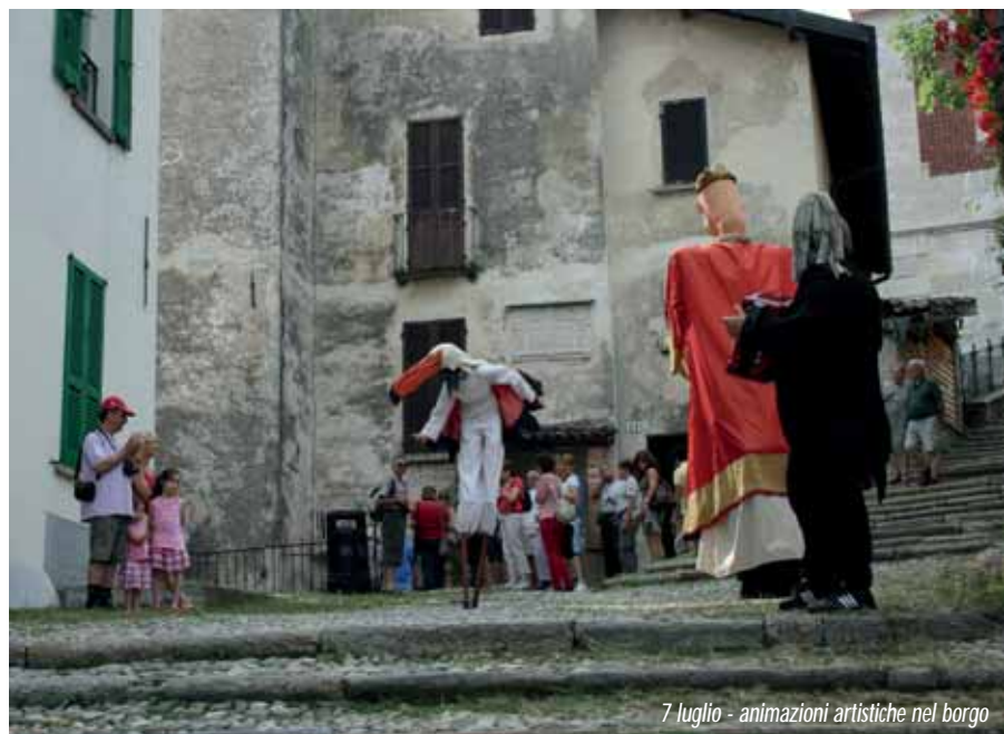
7 luglio - animazioni artistiche nel borgo

Assessore alla Promozione Turistica e Marketing Territoriale - Comune di Varese