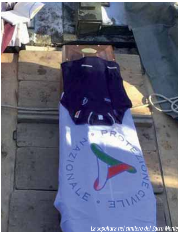
La sepoltura nel cimitero del Sacro Monte