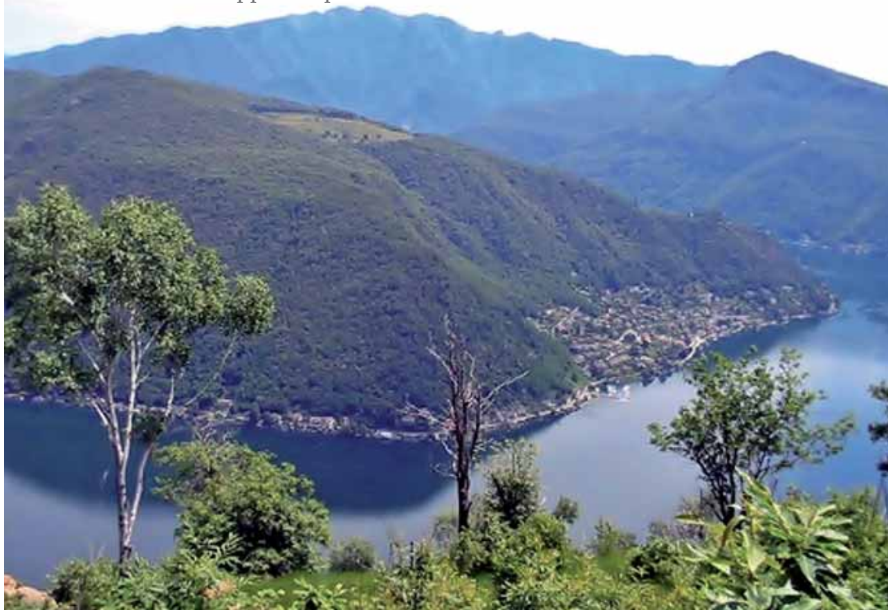
Monte Derta - Sasso Paradiso vista sul Ceresio

Marzio - Crotto San Filippo - Alpe Croce - Punta Paradiso - Cuasso al Monte