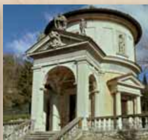
Settima Cappella – La Flagellazione 2011