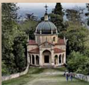
Quarta Cappella La Presentazione al Tempio 2017