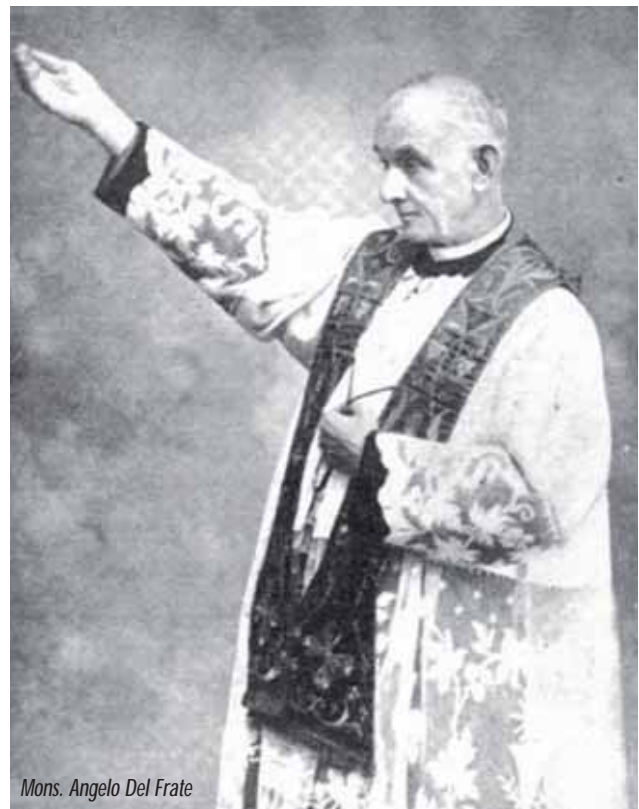
Mons. Angelo Del Frate