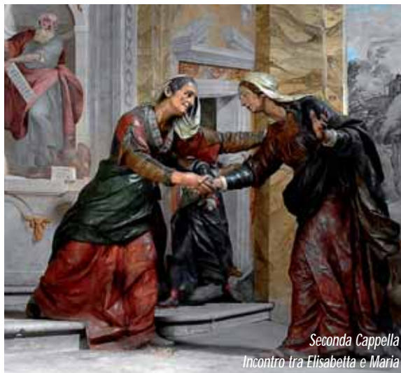
Seconda Cappella Incontro tra Elisabetta e Maria

Cominciando la nostra salita ideale, incontriamo la Prima Cappella, dove troviamo l'Arcangelo Gabriele con il braccio rivolto in avanti e l'indice della mano destra alzato verso l'alto, come chi sta comunicando qualcosa di importante, quasi nell'atto di benedire: è un gesto antico, che echeggia figure di arringatori o di imperatori romani colti nell'atto di pronunciare un discorso solenne. Maria ascolta l'angelo portando una