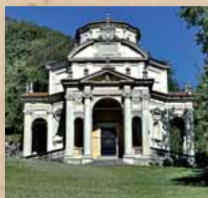
Quinta Cappella – Gesù tra i Dottori 2009