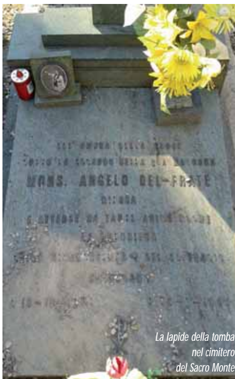
La lapide della tomba nel cimitero del Sacro Monte