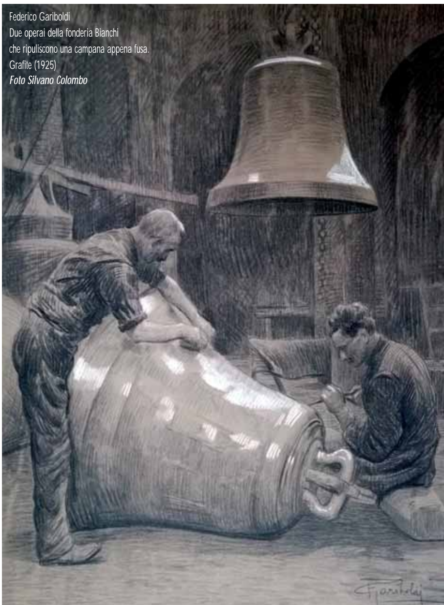
Federico Gariboldi Due operai della fonderia Bianchi che ripuliscono una campana appena fusa. Grafite (1925)