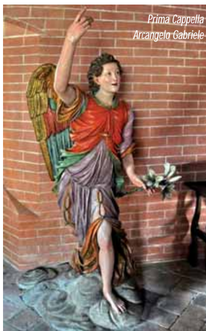
Prima Cappella Arcangelo Gabriele

mano al petto e mostrando il palmo dell'altra, come a voler recepire e meditare le parole che le vengono annunciate.