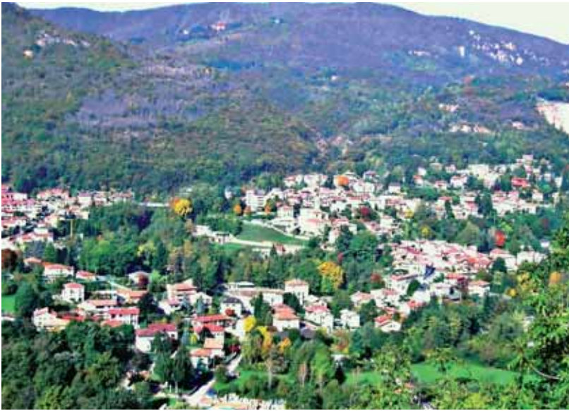
Cuasso al Monte

Ginnico, alla località Sentinella. Seguire a sinistra scendendo sino al Vallone: confluenza con il torrente originato dal Monte Piambello.