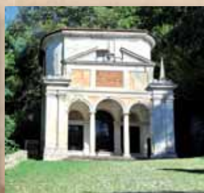
Decima Cappella – La Crocefissione 2010