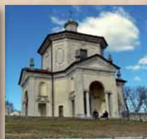
Quattordicesima Cappella L'Assunzione di Maria 2013