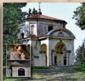
Sesta Cappella - Gesù nell'Orto degli Ulivi e Grotta delle Beate 2018