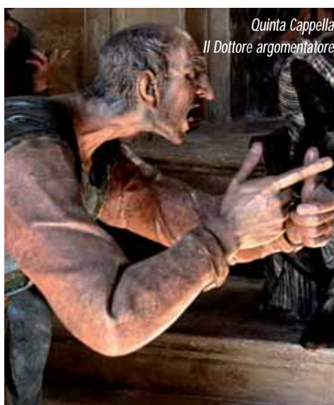
Quinta Cappella Il Dottore argomentatore

XIV secolo e fino all'età della Controriforma conosce grande fortuna: in seguito fu per lo più osteggiata dalla Chiesa perché considerata indecorosa, oltre che non rispettosa del racconto evangelico. L'Addolorata della cappella della Crocifissione, come quella della Salita al Calvario, pur esprimendo una sofferenza che indebolisce il corpo, preserva infatti la propria dignità, mantenendo una nobile compostezza.