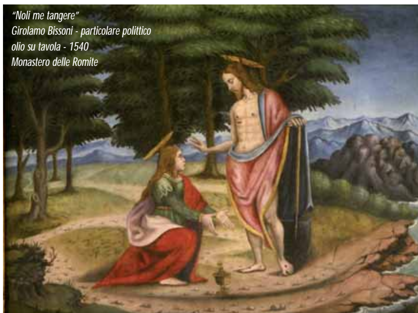
“Noli me tangere” Girolamo Bissoni - particolare politico olio su tavola - 1540 Monastero delle Romite

attraverso le lacrime e l'ombra di morte, fino alla Vita: questo ci è offerto da quel mattino, nel giardino della risurrezione, quando risuonò la domanda “Perché piangi?” e voltandosi una donna incontrò Colui che cercava tra i morti, ma che, risorto e chiamata per nome, la inviava ad annunciare un amore forte come la morte e il Vivente come compagno di cammino che, chiamandoci per nome, ci accompagna passo – passo da ora e per sempre ... comunione di cammino, comunione che è pienezza di Vita.