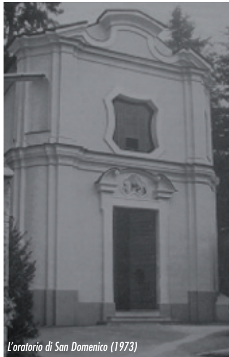
L'oratorio di San Domenico (1973)

(L'imbiancatura a due mani è così specificata: "per cornici tutte, lesene, capitelli sarà data tinta bianca venata a foggia di marmo bianco"; "agli specchi tutti verrà data tinta azzurra come pure alla volta ed alla volta sopra l'altare"; "alle rimanenti murature verrà data tinta color aurora chiara"; "lo zoccolo di tali murature, come pure le fasce intorno all'altare, verrà figurato marmo varaveggia" (marmo macchiavecchia di Arzo, in Canton Ticino)". La porta d'ingresso risistemata dalle fessurazioni nelle tavole, verrà verniciata a biacca e ad olio "color bronzo". La facciata sarà restaurata nelle "attuali dimensioni e forme" e verrà provvista, per la cimasa e gli sporti, di coperture e dei rispettivi canaletti in "lamiera di ferro calindrata di Germania" verniciata "color mole- ra". La facciata sarà poi ridipinta secondo le indicazioni del Priore. Verrà restaurata e intonacata la parete esterna volta a tramontana. La calce dovrà provenire dalle fornaci di Arcisate, la sabbia dalla strada detta di Faè.)