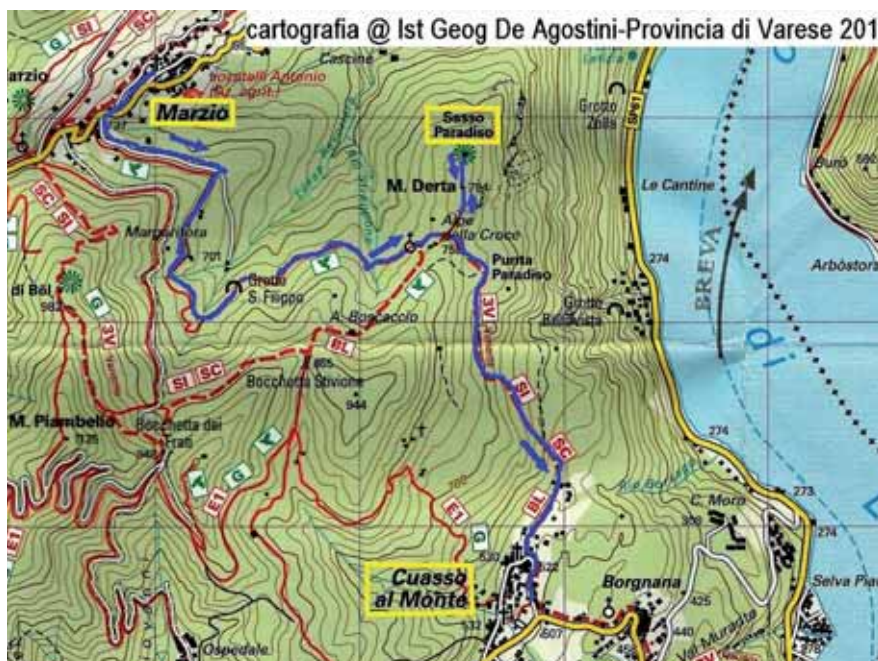
Cartina Marzio - Cuasso al Monte

Dal centro di Marzio salire con la via Roma sino all'intersezione a sinistra con via Porto Ceresio. Prendere quest'ultima via che quasi in piano conduce, oltrepassato l'inizio del Percorso