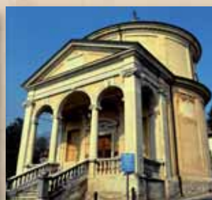
Chiesa dell'Immacolata 2016