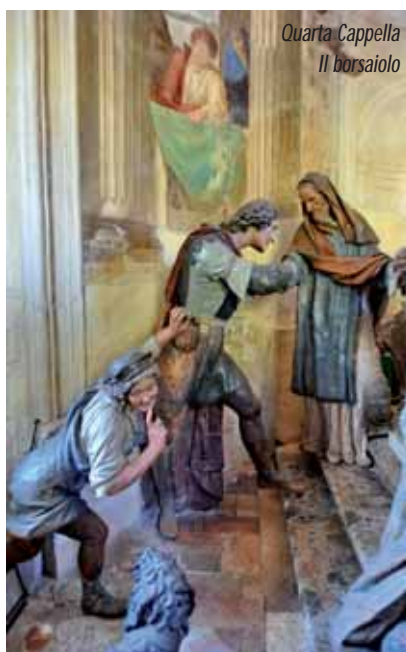
Quarta Cappella Il borsaio

Anche nella Decima Cappella, ultima dei Misteri Dolorosi, si trovano ritratte le espressioni più disparate, con particolare riferimento alla statua della Madonna, sorretta da due donne, rappresentata mentre, per il grande dolore, sente venir meno le forze. L'iconografia detta dello Spasimo, con la Vergine svenuta alla vista della Passione del Figlio, compare nel