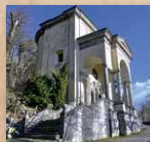
Undicesima Cappella La Resurrezione 2014