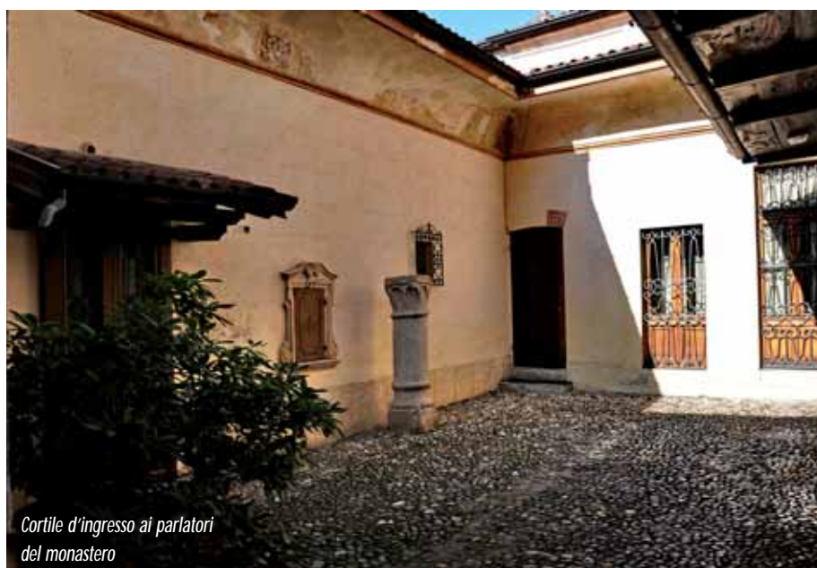
Cortile d'ingresso ai parlatori del monastero