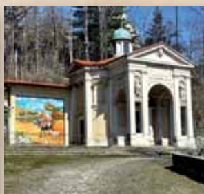
Terza Cappella – La Natività 2012