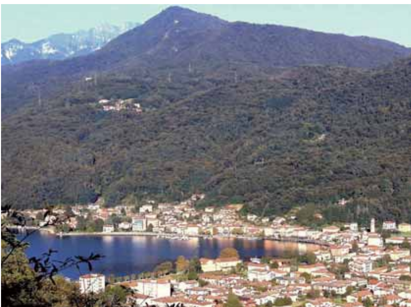
Valceresio - Porto Ceresio

Ci troviamo presso il Crotto San Filippo (30 minuti) ove vicinissima si incontra una fonte con acqua ricca di magnesio e ferro e assai curativa.