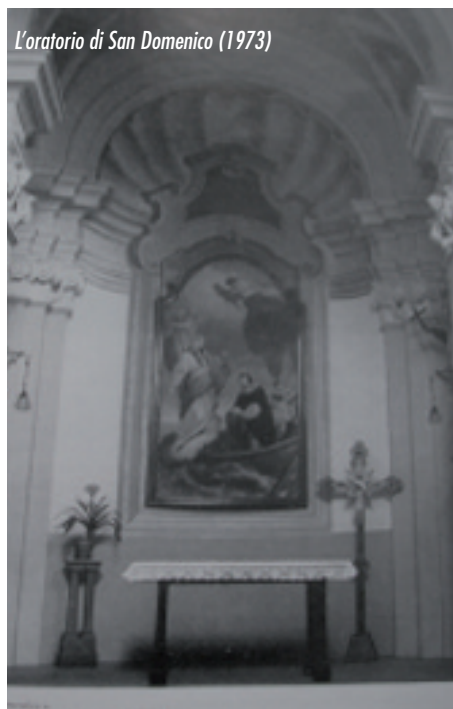
L'oratorio di San Domenico (1973)