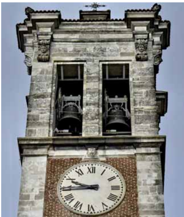
Cella campanaria del campanile del Sacro Monte