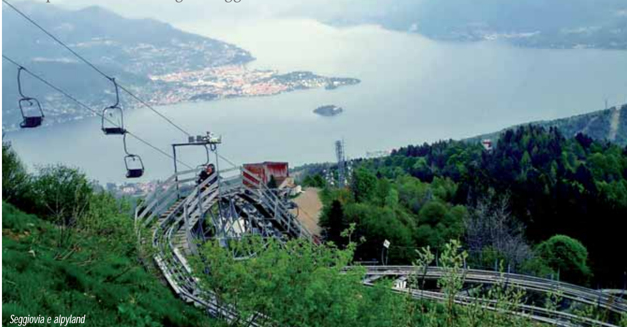
Seggiovia e alpyland

Itinerario Alpino (Giardino Alpina)-Mottarone vetta con vista panoramica sui Laghi Maggiore e d'Orta.