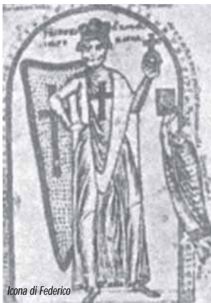
Icona di Federico

La mattina del 26 maggio 1859 i Cacciatori delle Alpi di Giuseppe