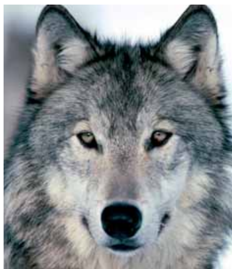
Un bell'esemplare di lupo

Narrano che a Cazzago Brabbia viveva, in tempi lontanissimi, una giovane donna così sicura di sé (con una grande autostima, diremmo oggi) che in paese veniva soprannominata "Maria la Sapien-