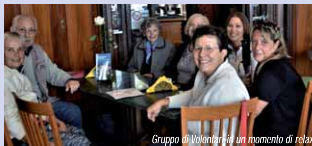
Gruppo di Volontari in un momento di relax