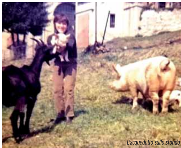
L'acquedotto sullo sfondo

Non solo. In inverno, quando nevicava (e all'epoca di neve ne faceva tanta!) Lo si vedeva con il trattore e la cala a tutte le ore, avanti e indietro per ripulire le strada del Sacro Monte. Era anche facile trovarlo nei prati a fare fieno per gli animali del convento delle Romite Ambrosiane.