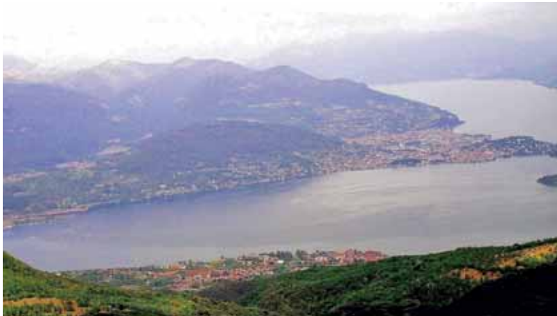
la baia tra Stresa Baveno Verbania