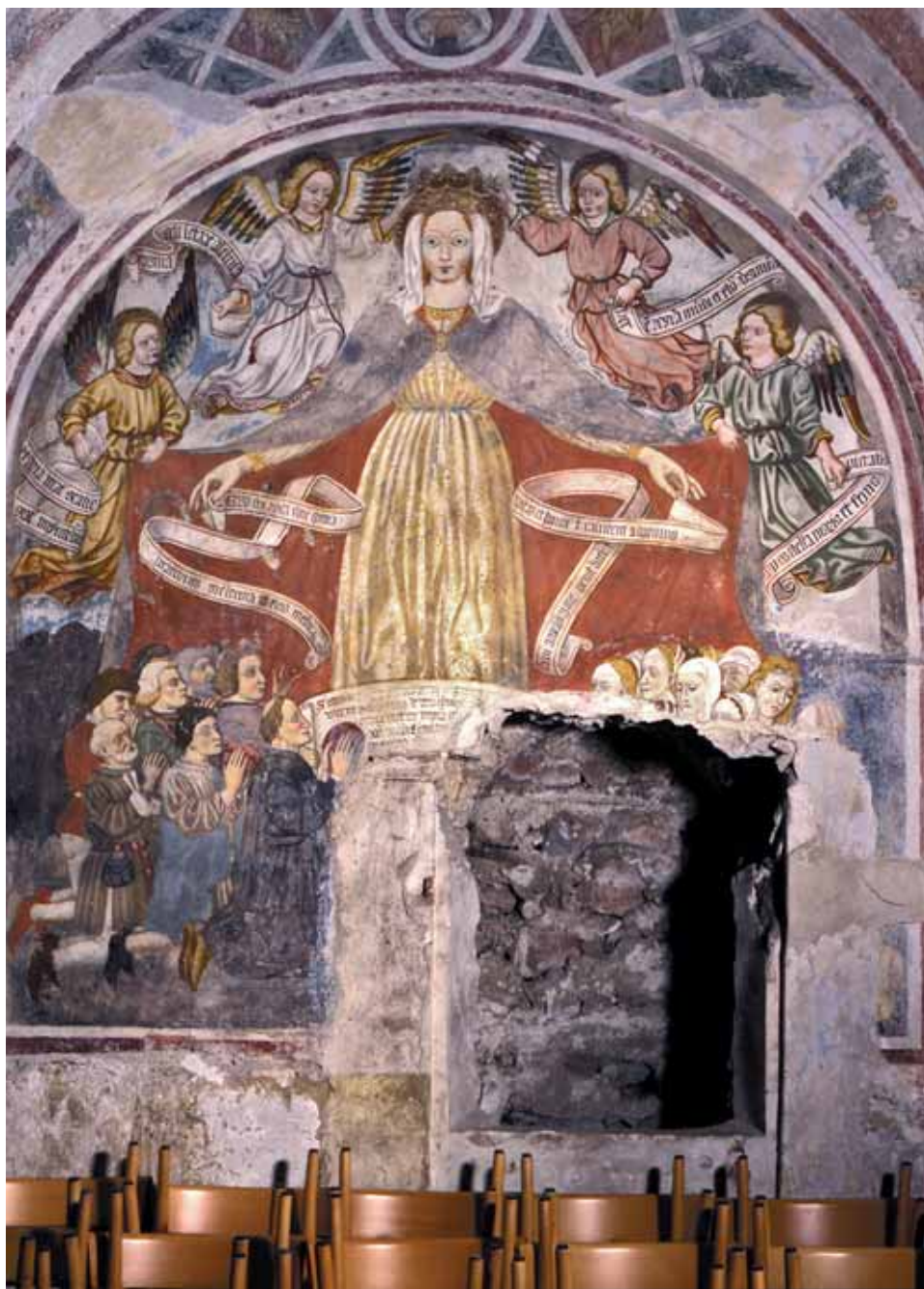
L'affresco della Madonna della Misericordia nella Badia di Ganna

Il cartiglio più grande, ai piedi della Vergine, fa riferimento al papa Sisto IV Francesco Della Rovere (1471-1484), che nel 1477 istituì la festa dell'Immacolata Concezione promettendo 12 mila anni di indulgenza – in pratica una garanzia eterna - a chi si affidava al culto della Madonna concepita senza la macchia del peccato originale. Un insegnamento che precorreva i tempi poiché il dogma dell'Immacolata Conce-