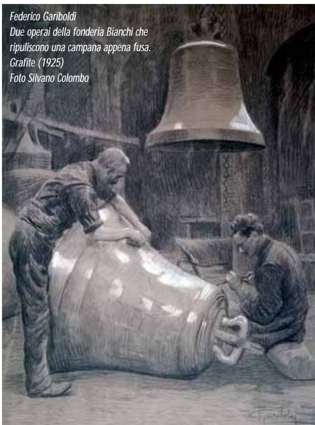
Federico Gariboldi Due operai della fonderia Bianchi che ripuliscono una campana appena fusa. Grafite (1925)

seguito venivano certificati con la sigla o il timbro della Fonderia Bianchi.