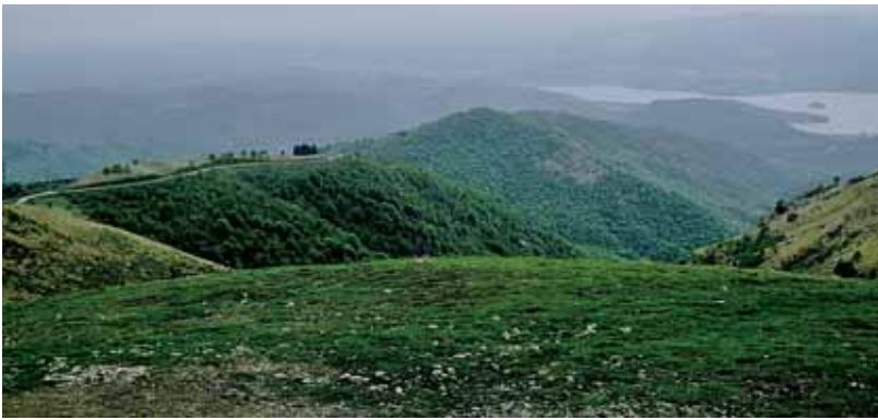
Lago d'Orta e Isola di S Giulio