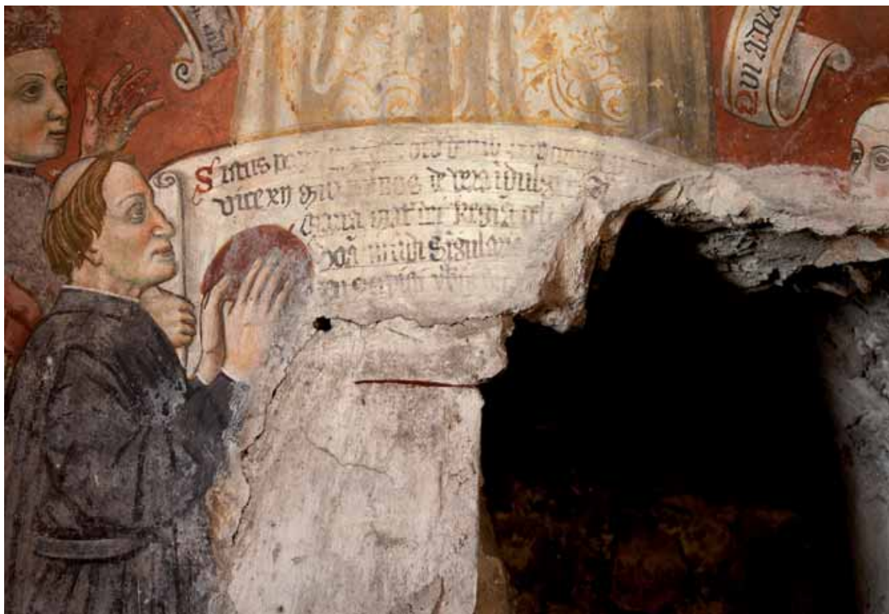
L'abate Leonardo Sforza e il cartiglio che fa riferimento al papa Sisto IV, particolare dell'affresco