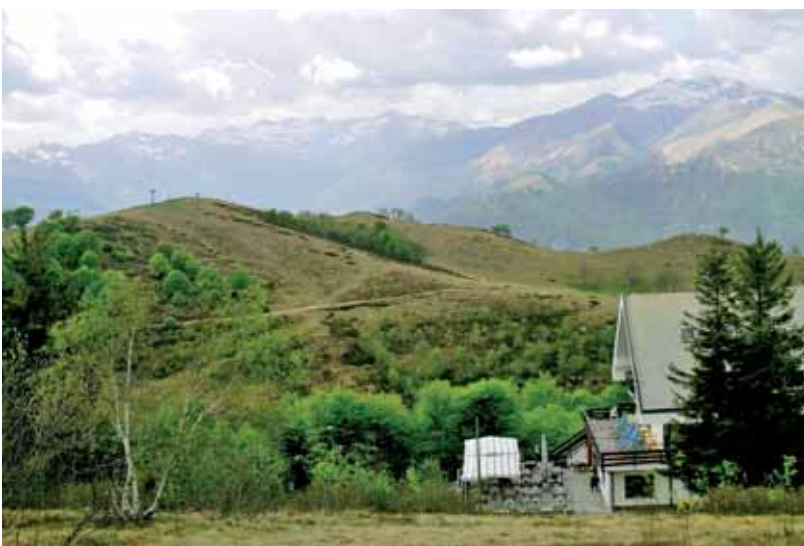
vista verso la Val d'Ossola

L'itinerario qui proposto parte da Alpino a 800 metri circa e utilizza l'intero sentiero panoramico sino alla vetta del Mottarone. Nella località v'è l'interessante Giardino Botanico Alpino, balcone in posizione dominante sulla zona centrale del Lago Maggiore. Il Giardino offre oltre 700 specie differenti di piante, per lo più alpine, ma anche Orientali o Americane. Simbolo di Alpino, fondata da Iginio Ambrosini nel 1934, è la genziana.